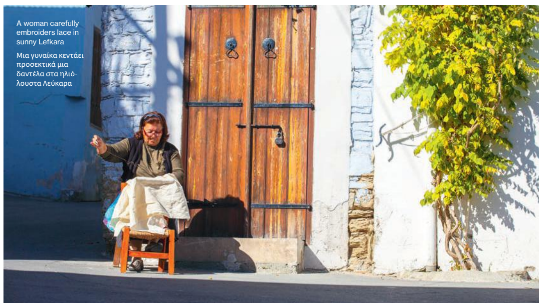
A woman carefully embroiders lace in sunny Lefkara

Τα Λεύκαρα είναι διάσημα για τη δαντέλα τους εδώ και αιώνες και, το 2009, η UNESCO την προσέθεσε στον Κατάλογο Άυλης Πολιτιστικής Κληρονομιάς. Κάθε κομμάτι είναι εξ ολοκλήρου χειροποίητο με σχολαστική λεπτομέρεια, χρησιμοποιώντας τεχνικές όπως αζούρ, κοφτή και σατινέ γεμίσματα. Από τη δεκαετία του 1950, οι τεχνίτριες ασχολούνται με το ιρλανδικό λινό το οποίο ξεχωρίζει για τη λεπτή, ομοιόμορφη ύφανσή του που αναδεικνύει τις περίπλοκες βελονιές. Όλα δημιουργούνται από μνήμη, με τεχνικές που μεταδίδονται από γενιά σε γενιά. Δυστυχώς, όμως, η δεξιοτέχνη δεν μεταδίδεται εξίσου γρήγορα, και, σήμερα, η δαντέλα των Λευκάρων θεωρείται μια τέχνη που πεθαίνει. Ήρθα στα Πάνω Λεύκαρα για να δω τι έχει απομείνει από αυτήν την παράδοση και ποιος αγωνίζεται να την κρατήσει ζωντανή.