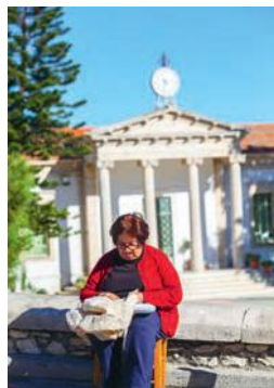
Lefkara (above) is a beautiful, traditional village

Demosthenes's Duomo story shows what Lefkara lacework once represented – international recognition, skilled artisans and months of collective work. But Rouvis estimates that only 40-50 women in Lefkara still know how to embroider the traditional lacework today, and 20 of them supply pieces to his shop. It's